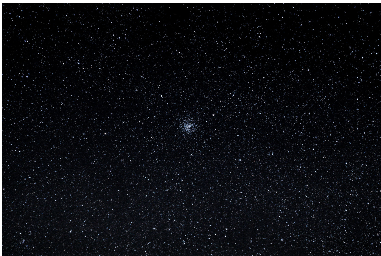
M37 Canon 100D objectif 70-300 à 200mm empilement plusieurs photos et traitement

Ci dessous les 2 photos réalisées de Fred après compilation et traitement.