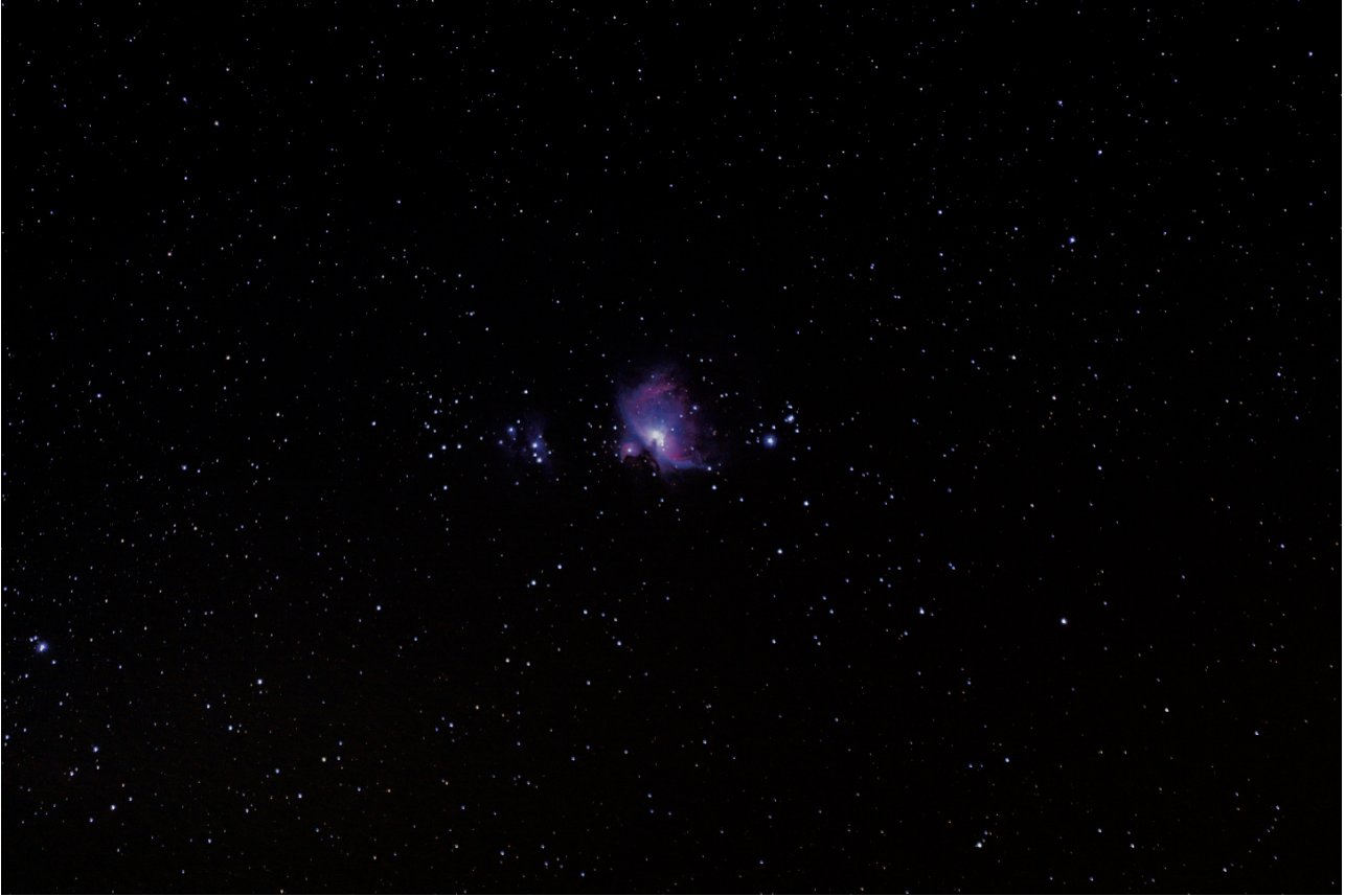
M42 Canon 100D objectif 70-300 à 200mm empilement plusieurs photos et traitement